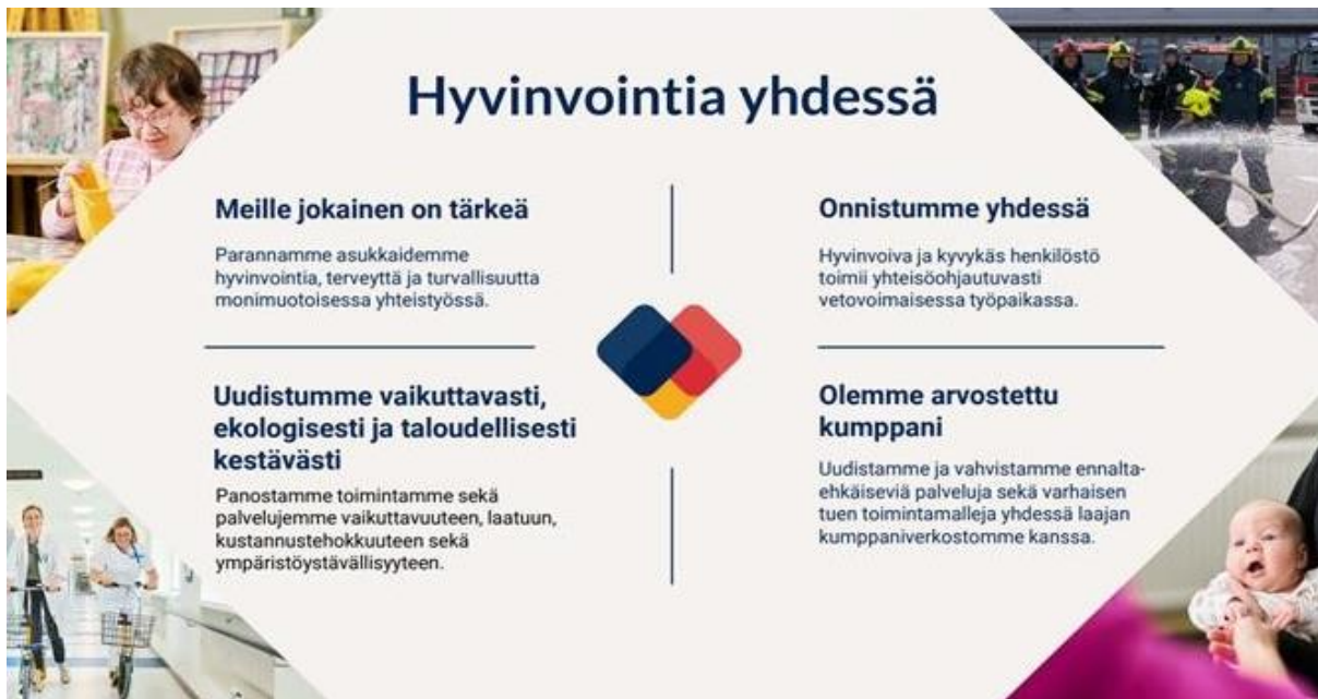
Kuva 7. Keski-Uudenmaan hyvinvointialueen strategia

Neuvolapalveluja kehitetään lainsäädäntöön, perhekeskustoimintamalliin ja hyvinvointialueen strategiaan (2020–2025) nojaten. Strategian mukaisesti toimintaa kehitetään siten, että asiakastyytyväisyys, vaikuttavuus ja henkilöstön hyvinvointi kasvavat, mutta kustannukset eivät olennaisesti kasva. Kuvassa 7 on kuvattuna Keusoten strategian tavoitteet vuoteen 2025 saakka.