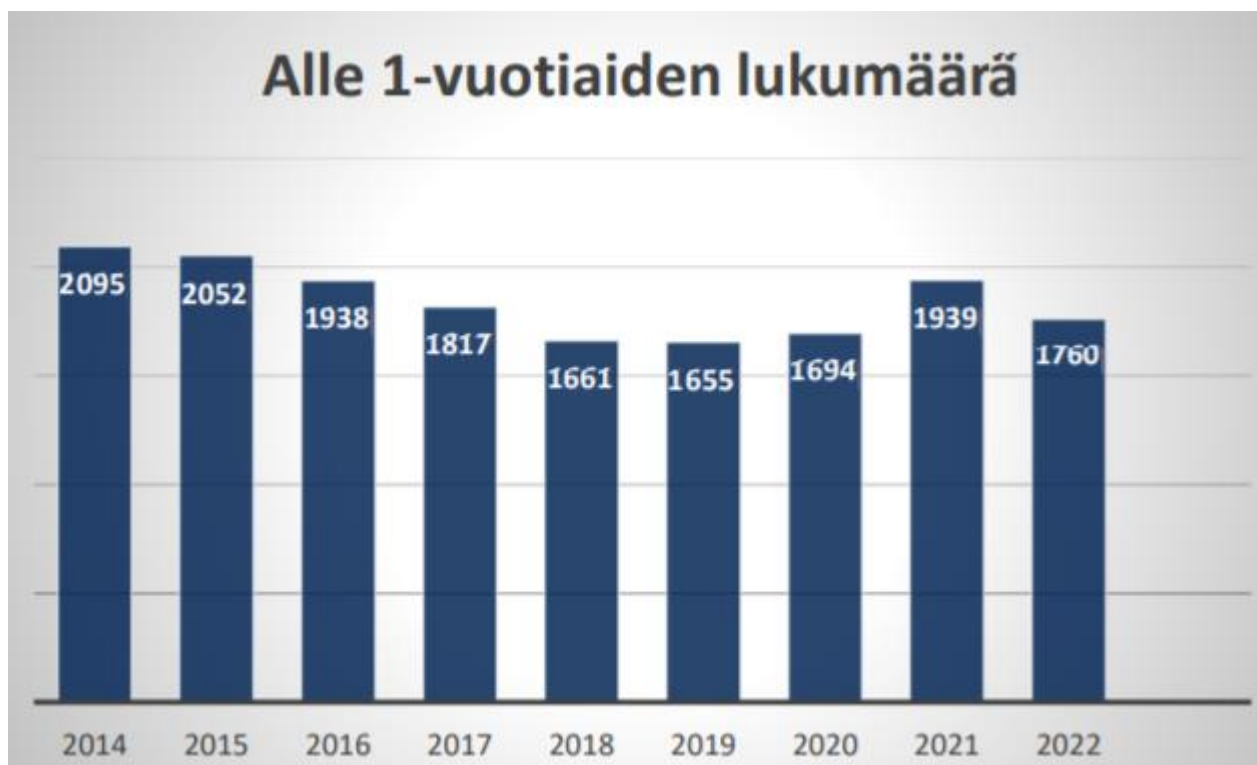
Kuva 3. Alle 1-vuotiaiden lukumäärä Keski-Uudenmaan hyvinvointialueella

Keski-Uudellamaalla syntyvyys on laskenut viimeksi kuluneen kymmenen vuoden aikana 335 (16 %) lapsella, joskaan lasku ei ole ollut tasaista. Pandemia vuonna 2021 lapsia syntyi viime vuosille tyypillistä enemmän. Syntyvyys on kääntynyt jälleen laskusuuntaan.