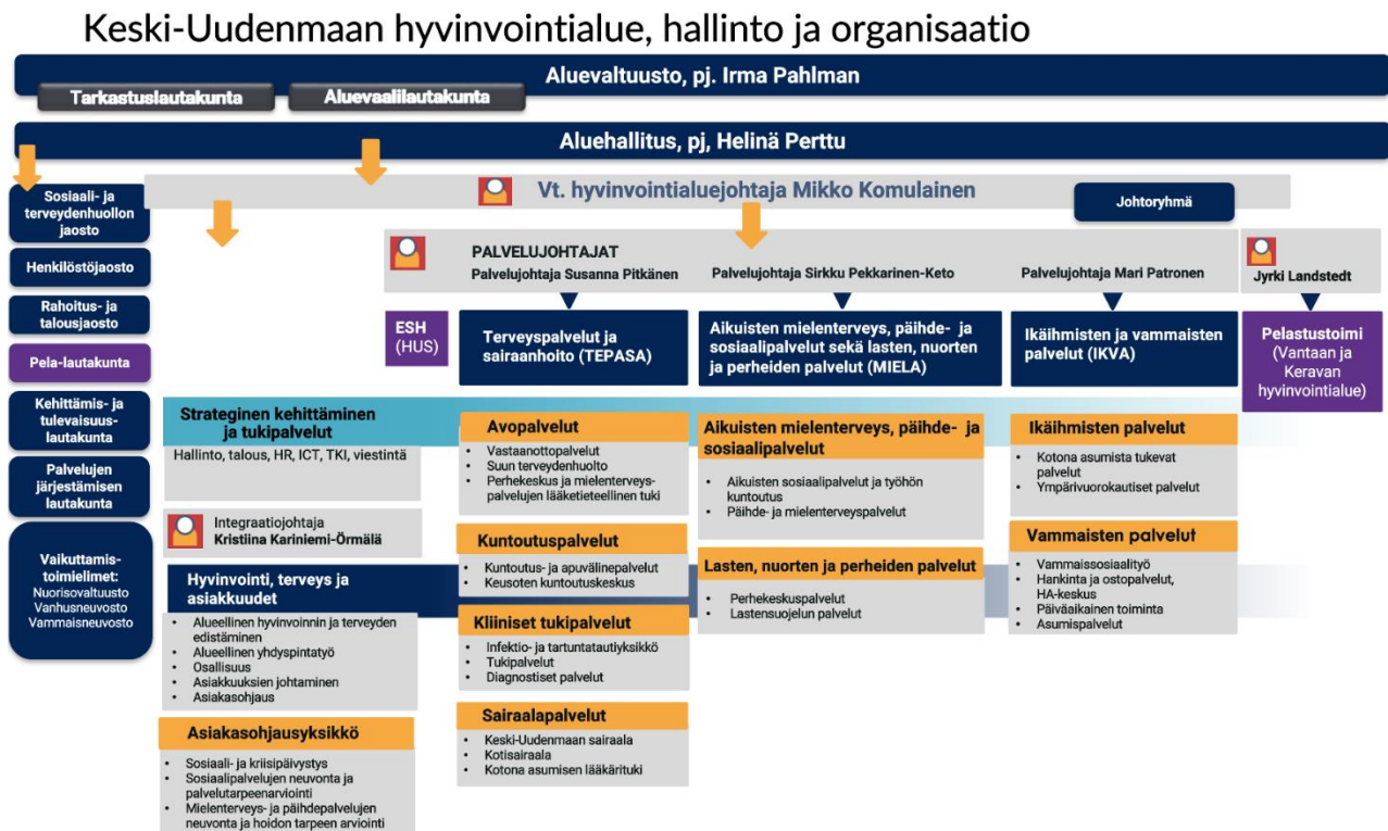
Kuva 1. Keski-Uudenmaan hyvinvointialueen hallinto ja organisaatio

Keski-Uudenmaan hyvinvointialueen tuottamat sosiaali- ja terveystaloudelliset palvelut on organisoitu neljälle eri palvelualueelle: 1. Hyvinvointi, terveys ja asiakkaat, 2. Terveystaloudelliset palvelut ja sairaanhoito, 3. Aikuisten mielenterveys-, päihde ja sosiaalipalvelut sekä lasten, nuorten ja perheiden palvelut ja 4. Ikäihmisten ja vammaisten palvelut. Palvelualueita johtavat palvelualuejohtajat.