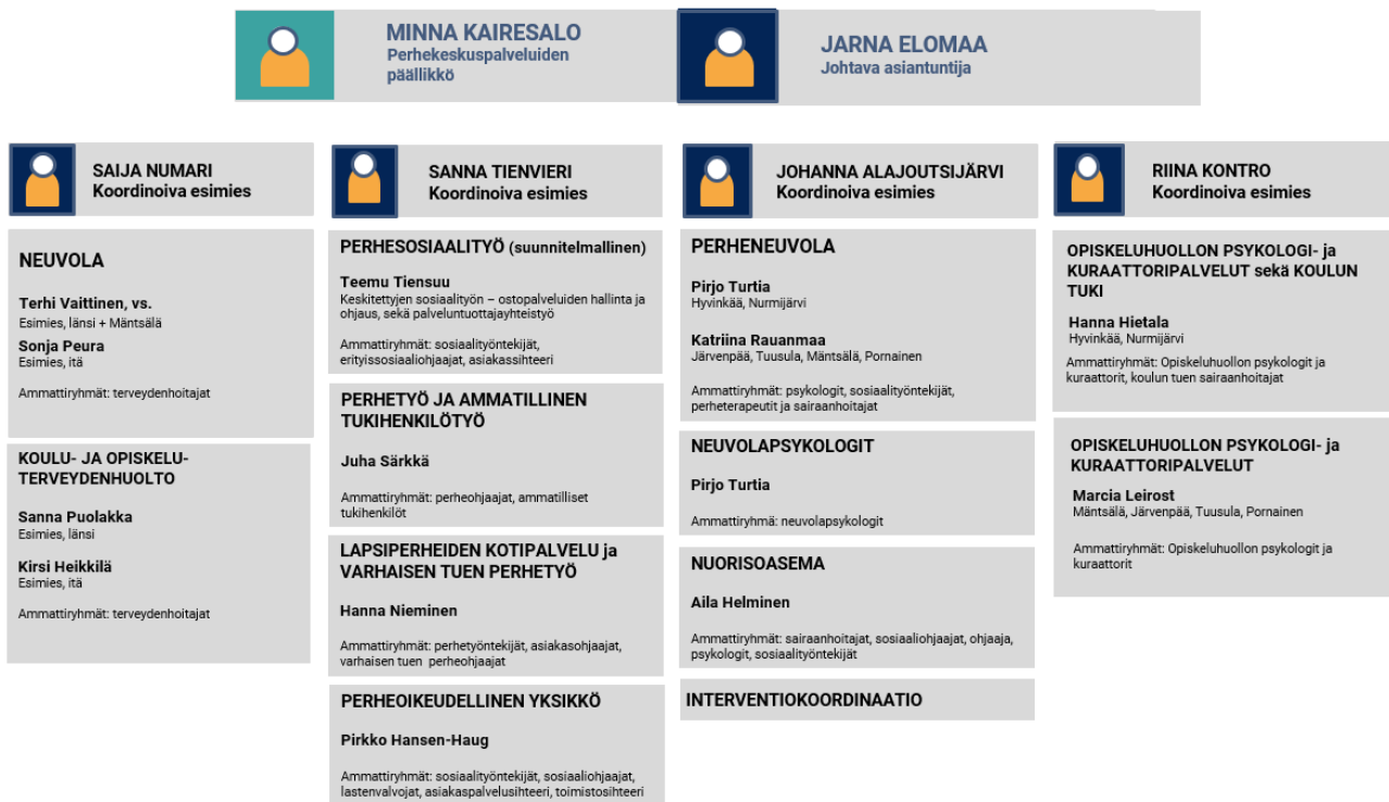
Kuva 2. Neuvolapalvelut vastuhenkilöineen osana perhekeskuspalvelujen tulosaluetta

Neuvolan operatiivista työtä johtaa koordinoiva esimies, jonka alaisuudessa toimii kaksi lähiesimiestä – toinen idän ja toinen lännen alueella. Koordinoiva esimies ja lähiesimiesten kokous toteutuu viikoittain ja terveydenhoitajien ja heidän esimiestensä kokoukset ovat kerran kuukaudessa. Neuvolan koordinoiva esimies kuuluu tulosalueen johtotiimiin, joka kokoontuu kerran viikossa.