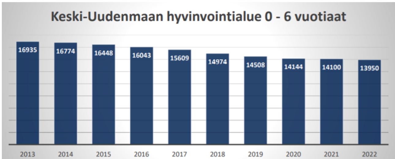
Kuva 4. Neuvolaikäiset lapset Keski-Uudenmaan hyvinvointialueella

Väestönkasvua pitää yllä Suomessa maahanmuutto ulkomailta. Keski-Uudenmaan alueella kuitenkin vieraskielisten ja syntyperältään ulkomaalaistaustaisten henkilöiden osuus on pieni verrattuna muuhun Uuteenmaahan. Alueen väestöstä ulkomaalaistaustaisten osuus oli 6,9 % vuonna 2022.